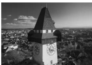
In Graz findet im März 2011 das nächste Opening statt

NLP“ ist dabei breit zu sehen. Führen im Betrieb